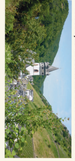
Steeg – Das idyllische Weindorf am Mittelrhein

Steeg liegt am Westrand der Stadt Bacharach in einem Tal des Hunsrück. Mittelpunkt des Ortes ist die Evangelische Kirche St. Anna. Der Ortsname Steeg leitet sich wahrscheinlich von „Steige“ ab, das eine vom Rheintal hoch zum Hunsrück führende Straße bezeichnete. Die über dem Ort befindliche Burg Stahlberg wurde im 12. Jahrhundert von den Kölner Erzbischöfen gebaut. Bereits 1243 ging sie zusammen mit Furstenberg als Lehen an die Wittelsbacher Pfalzgrafen. Im Mittelalter gehörte Steeg zu den vier „gefreite Thäler“ genannten Hauptorten eines ehemals im Besitz der Kölner Erzbischöfe befindlichen Gebietes, das noch heute „Vierthälergebiet“ genannt wird. Im Verthälergebiet und wohl auch darüber hinaus ist der Spottname der Einwohner von Steeg bekannt: „Früher mehr noch als heute nannte man sie die „Steeger Esel“.“